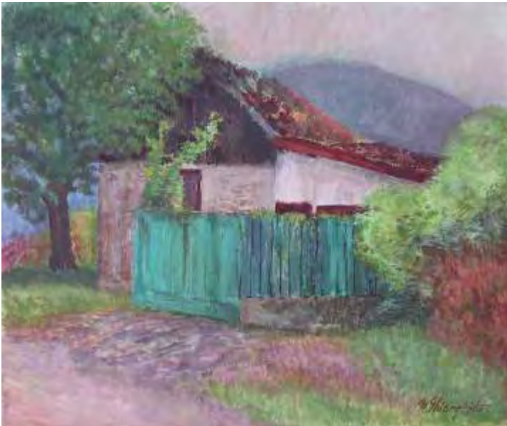
Cas veche , acrilic/pânză , 50x60 cm