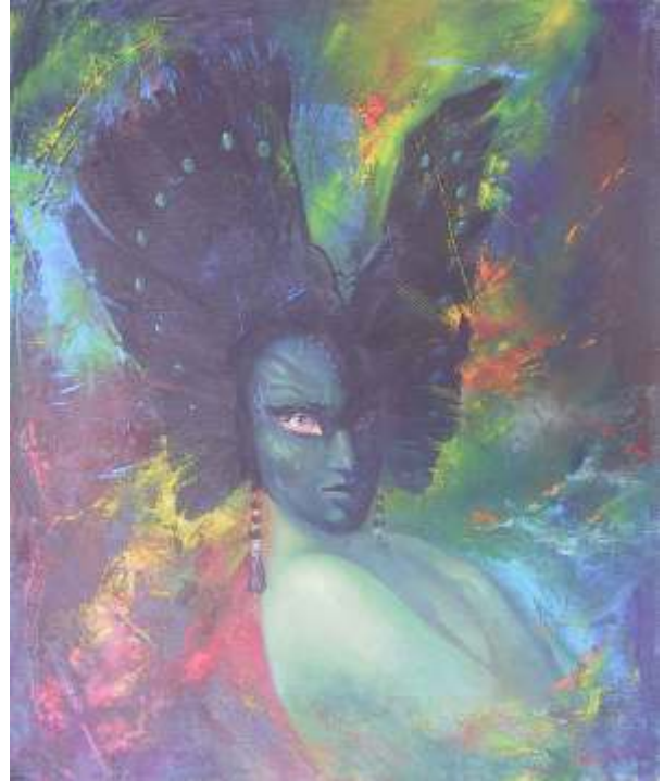
Regina mitor, ulei/pânză , 60x50 cm