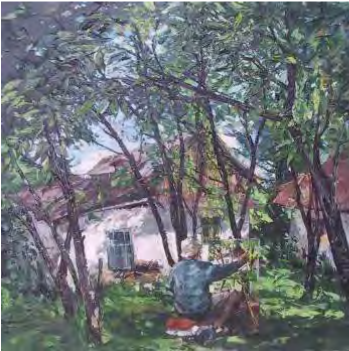
Peisaj, ulei/pânz , 60x60 cm