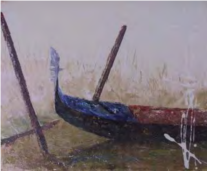
Solo , ulei/pânz , 50x60 cm