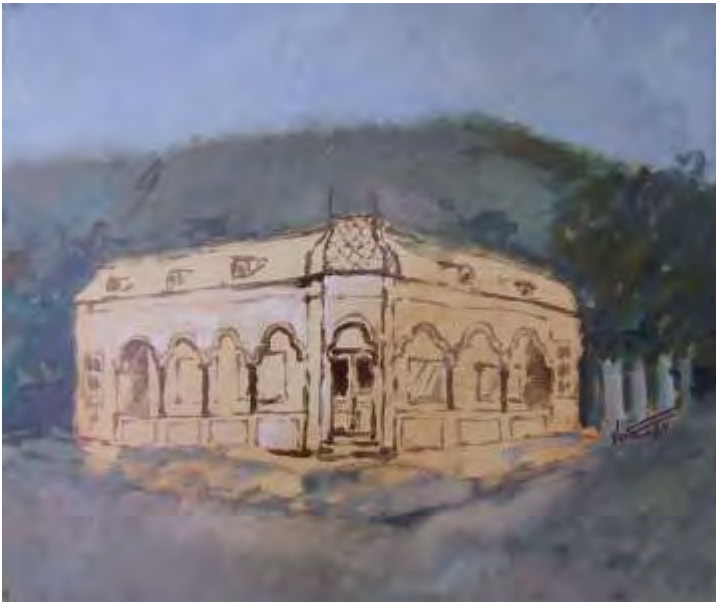
Parfum de epoc , ulei/pânz , 50x60 cm