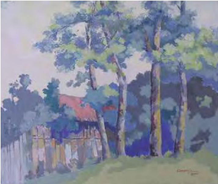
Peisaj cu cas , ulei/pânză , 50x60 cm