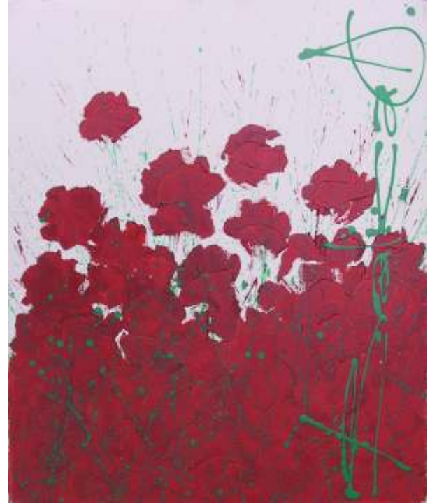
Maci , ulei/pânz , 60x50 cm