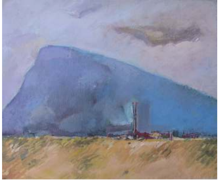
Spre Câmpina , ulei/pânz , 50x60 cm