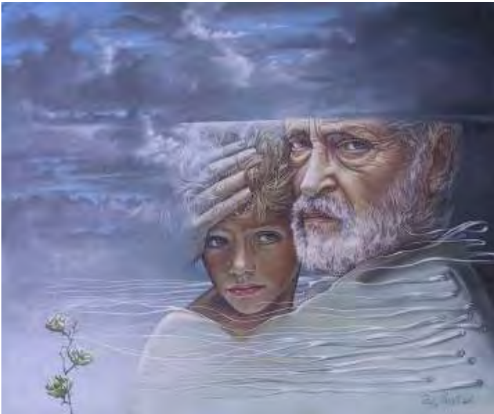
Amintiri din copilărie II , ulei/pânză , 50x60 cm