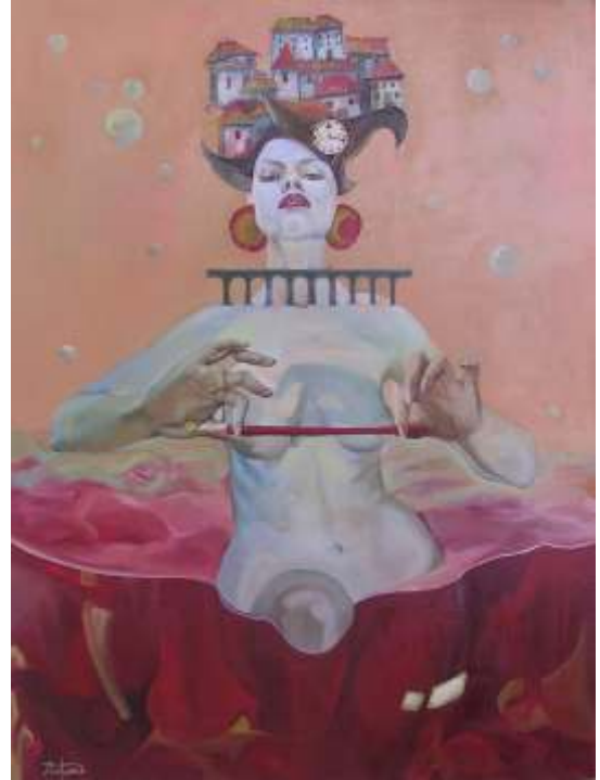
Reveria , ulei/pânz , 60x50 cm