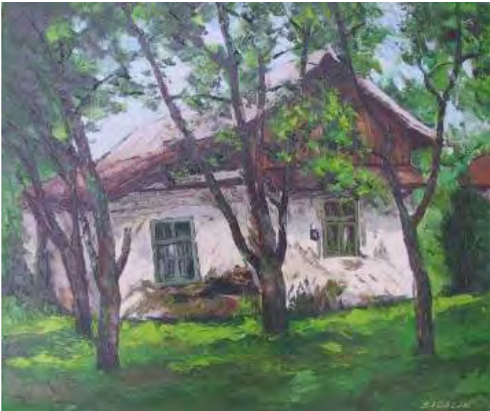
Cas la Cornu II , ulei/pânz , 50x60 cm