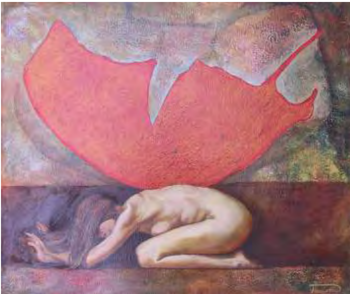
Butterfly , ulei/pânz , 50x60 cm