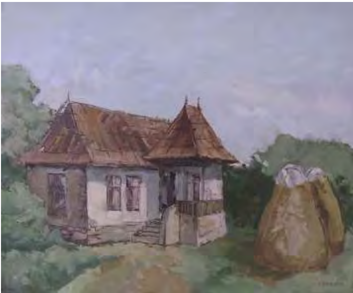
Casa bătrânească , ulei/pânză , 50x60 cm