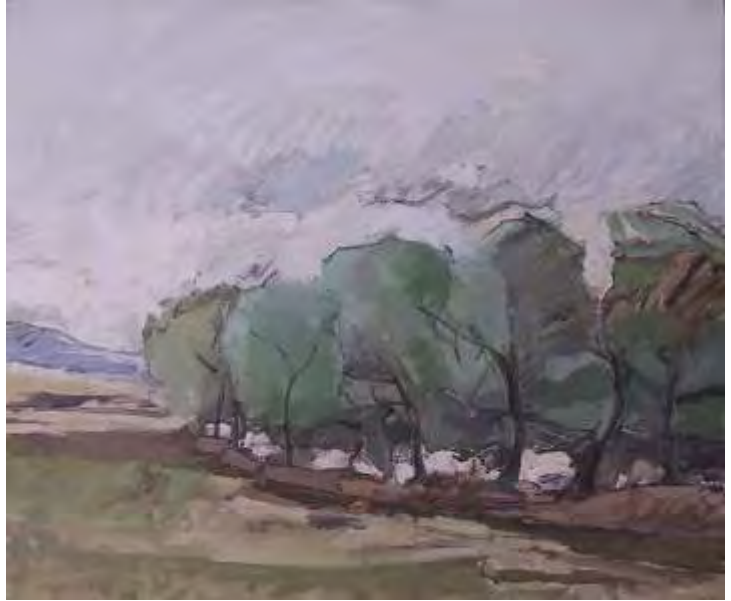
S licii la Cornu , ulei/pânză , 50x60 cm