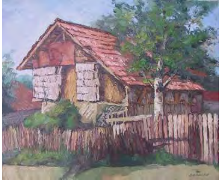
Cas la Cornu I , ulei/pânz , 50x60 cm