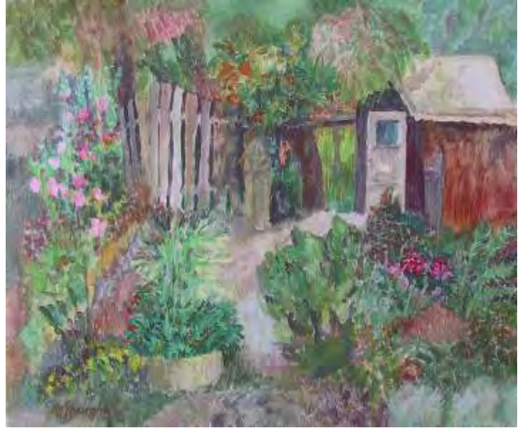
Gr din în Cornu , acrilic/pânză , 50x60 cm