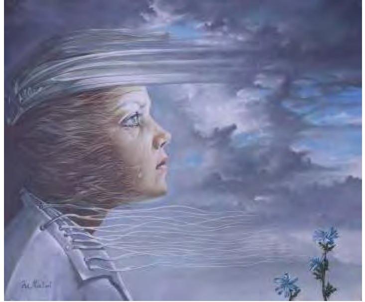
Amintiri din copilărie I , ulei/pânză , 50x60 cm