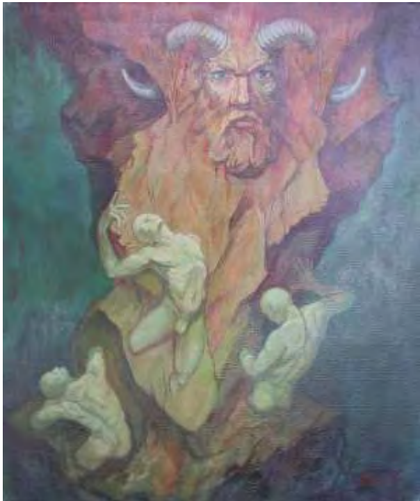
Templul naturii - pedeapsa capriciilor noastre, ulei/pânză , 60x50 cm