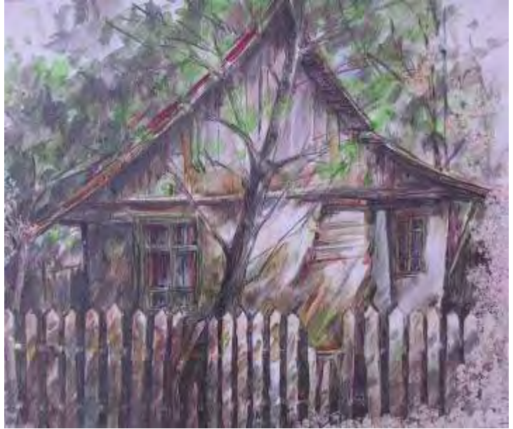
Peisaj, ulei/pânz , 50x60 cm