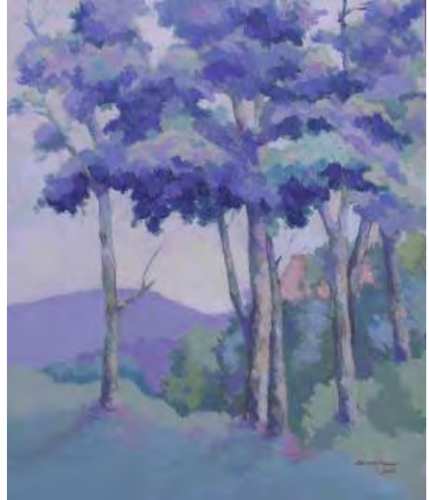
Peisaj din Cornu , ulei/pânză , 60x50 cm