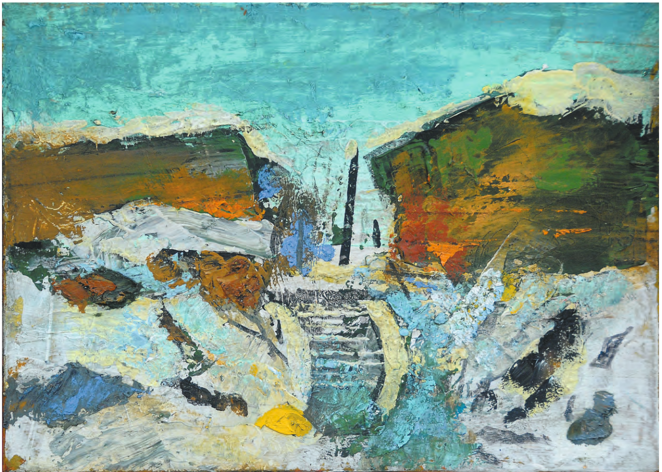
Moară de apă iarna , ulei/pânză, 38x56 cm