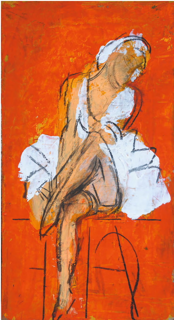
Dansatoare în pauză , ulei/pânză, 55x33 cm