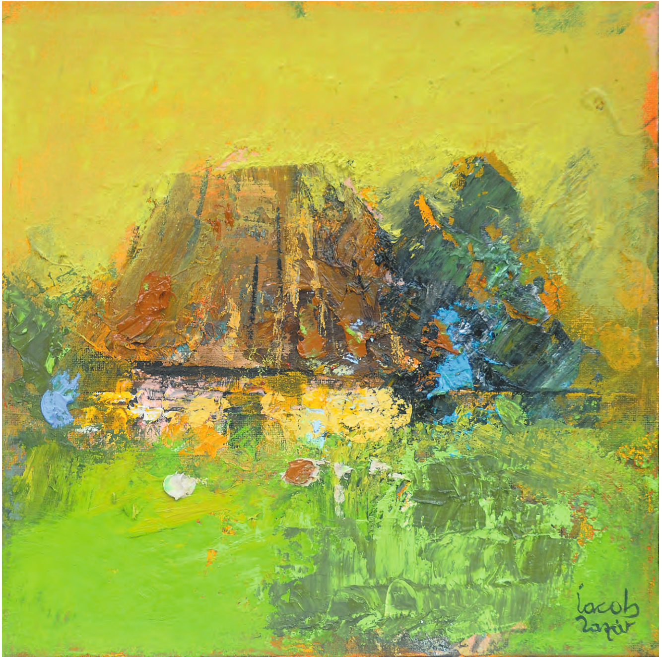
Casă la margine de sat , ulei/pânză, 50x50 cm