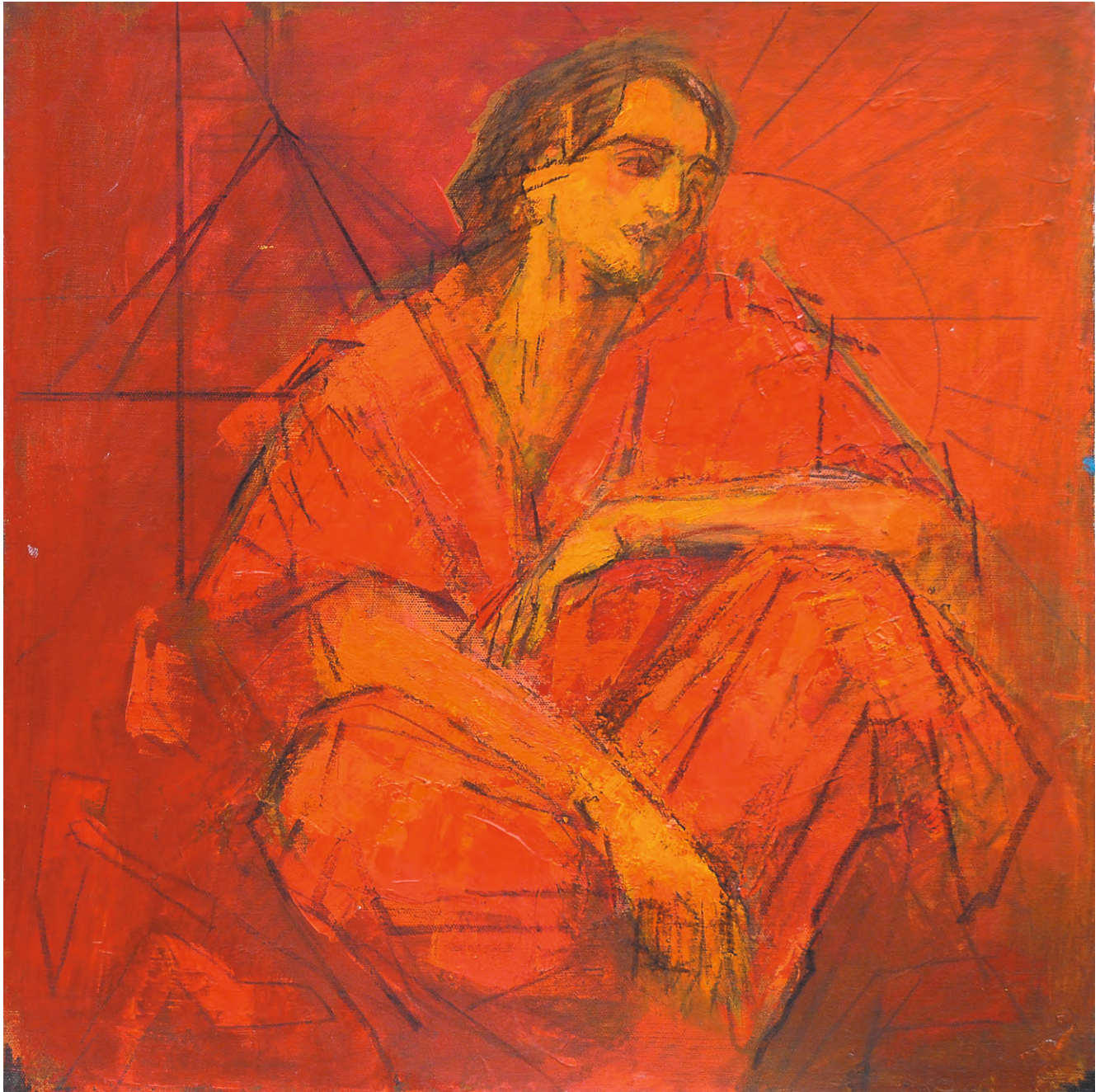
Eminescu , ulei/carton, 50x50 cm