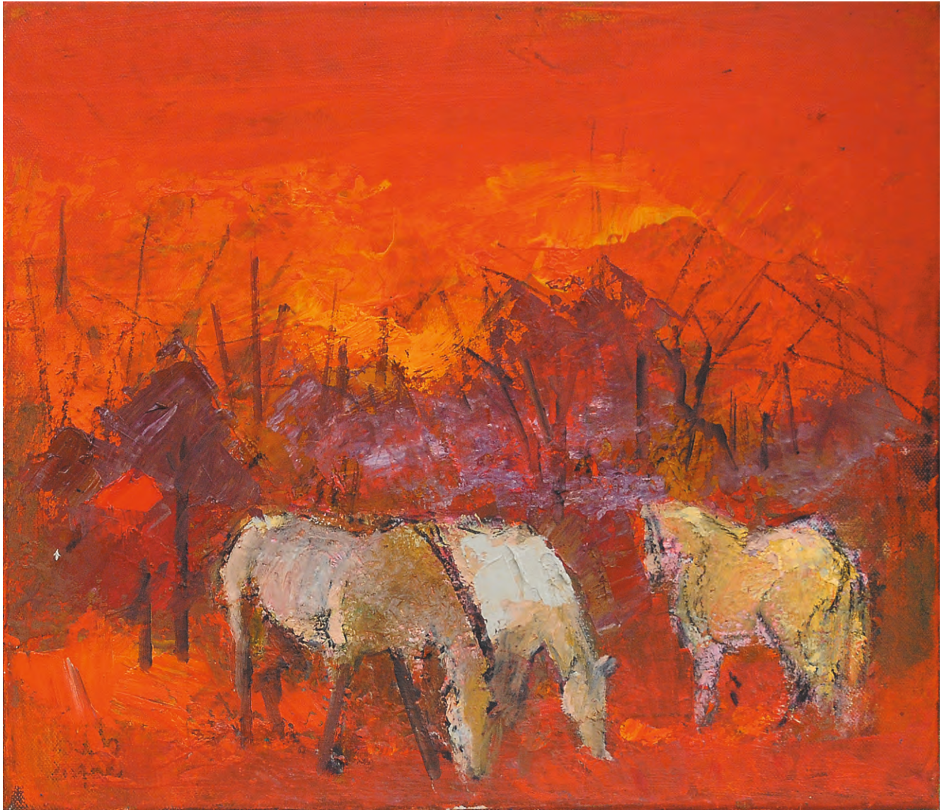
Amurg de toamnă , ulei/pânză, 35x50 cm