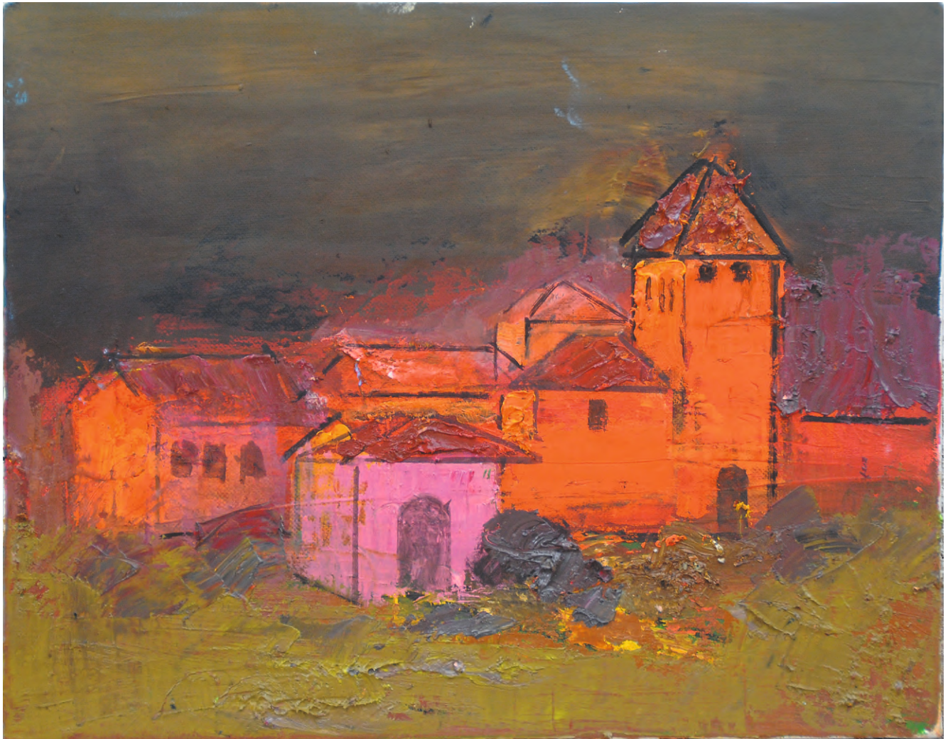
Conacul roșu , ulei/pânză, 26x38 cm