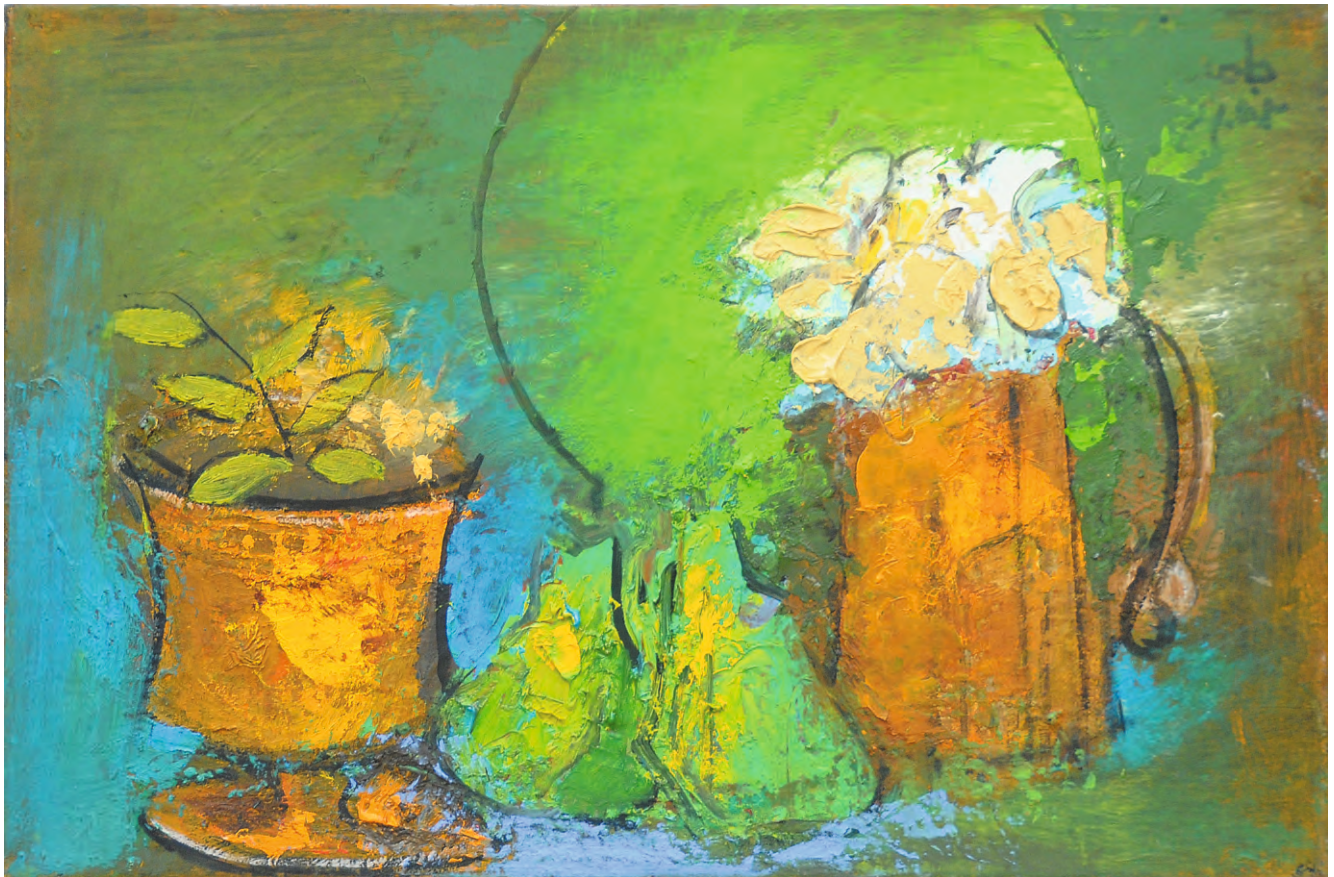
Natură statică de primăvară , ulei/pânză, 33x55 cm