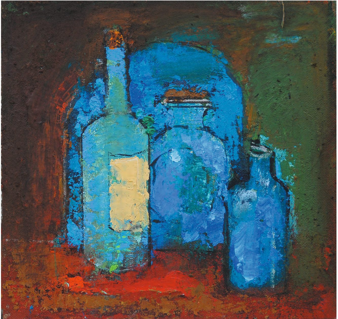
Vase cu pigmenți , ulei/pânză, 38x40 cm