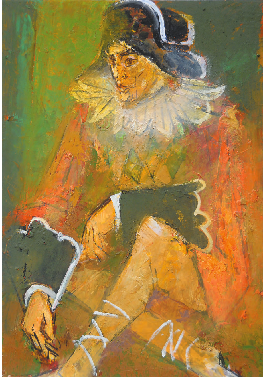
Arlechin între acte , ulei/pânză, 60x40 cm