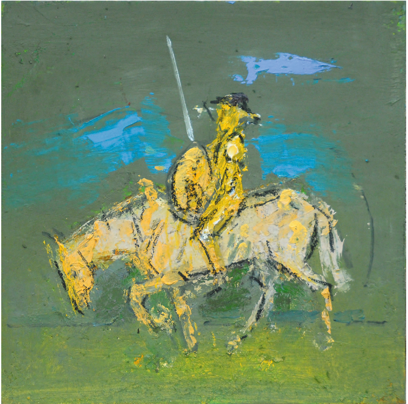
Don Quijote la luptă , ulei/pânză, 38x38 cm