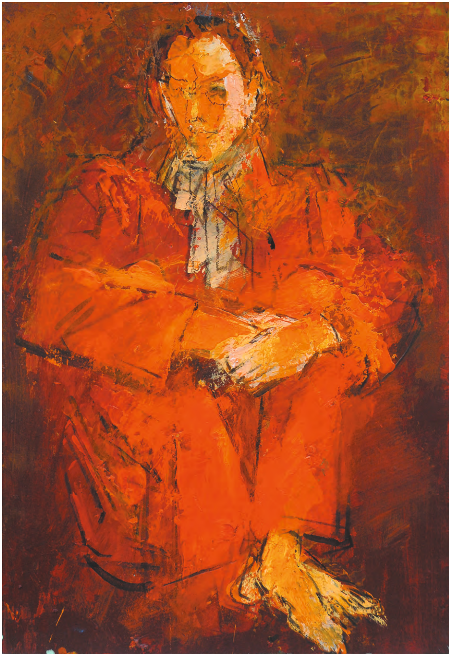
Actor , ulei/pânză, 55x36 cm