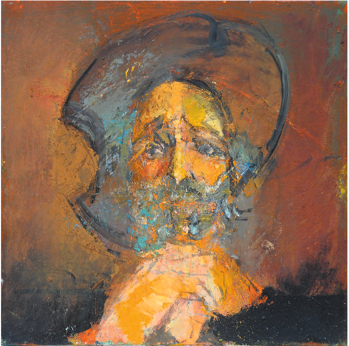
Don Quijote solitar , ulei/pânză, 42x42 cm