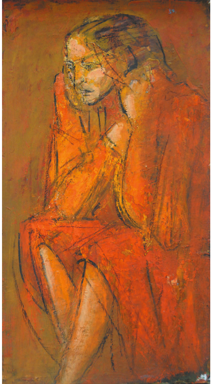
Penelopa oranj , ulei/pânză, 55x33 cm